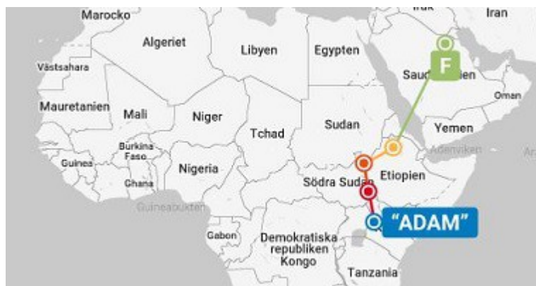
Gambar 2: Nabi Adam dan istrinya keluar dari surga dan menetap di daerah danau Viktoria (familytreeDNA)